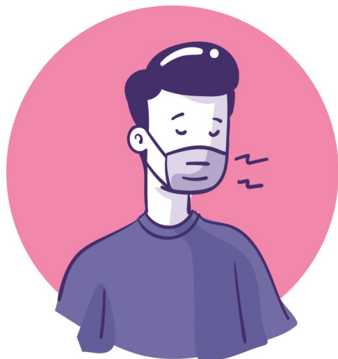
Zakryj nos i usta