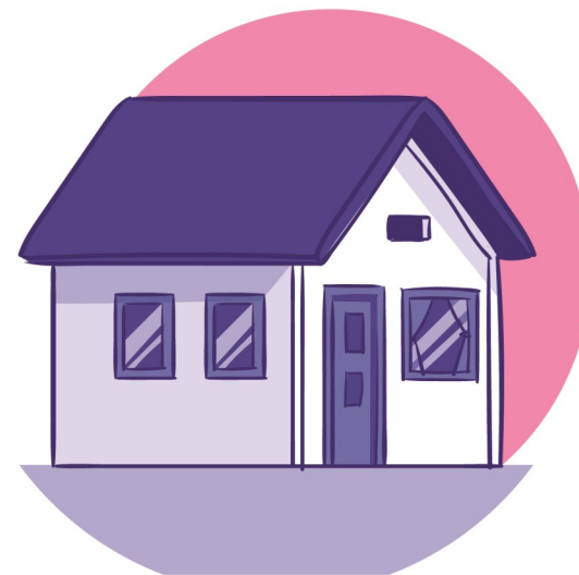
Czekaj na dziecko poza placówką